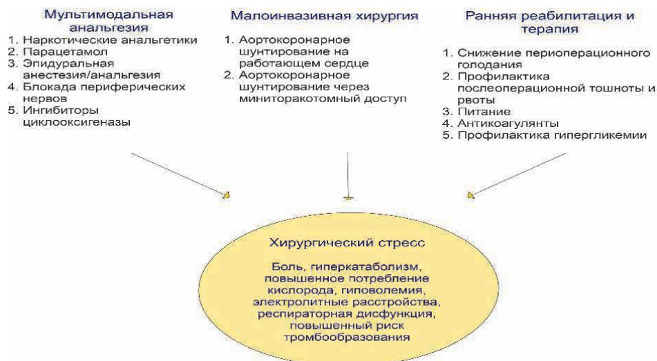
Fig. 1. Methods of abatement surgical stress in the concept of early surgical rehabilitation for coronary artery bypass grafting