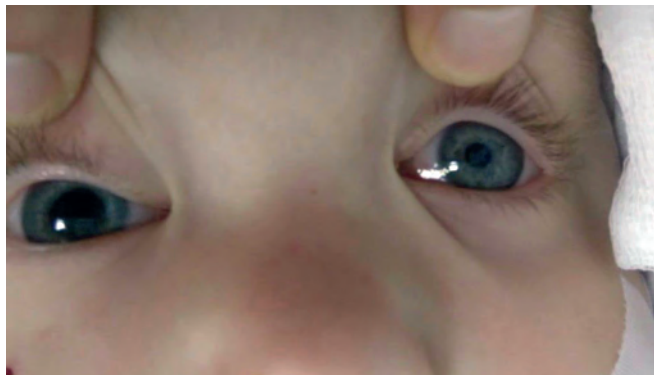
Рис. 2. Мидриаз после правильно выполненной ретробульбарной блокады.

Статистическую обработку полученных данных проводили с использованием пакетов прикладных программ для статистического анализа: Excel и SPSS 16.0 (SPSS, Чикаго, Иллинойс, США). Применялась описательная статистика, такая как среднее значение, стан-