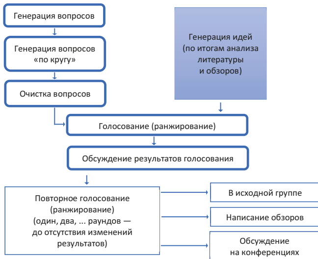
Рис. 2. Вариант графической схемы проведения опроса [4] Fig. 2. Sample of the flowchart of the survey [4]

Во времена отсутствия быстрых удобных незатратных электронных коммуникаций (1970–90-е гг.) для проведения одного раунда рекомендовалось выделять минимум 45 дней [17, 30], которые включали рассылку анкет, их заполнение, обратную отсылку и обработку. В то же время Delbecq et al. рекомендовали предоставить экспертам только на заполнение ответов в каждом раунде не менее 2 недель, даже с учетом стремления к минимизации времени между повторением опросов экспертов [17].