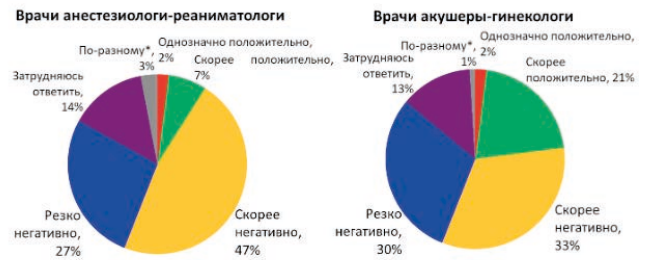
Рис. 2. «Как вы считаете, визуальный и тактильный контакт матери и мертворожденного ребенка оказывает положительное влияние на психоэмоциональное состояние женщины в долгосрочной перспективе?»

** I consider sedation necessary, but I do not use it due to the lack of conditions for its safe administration.